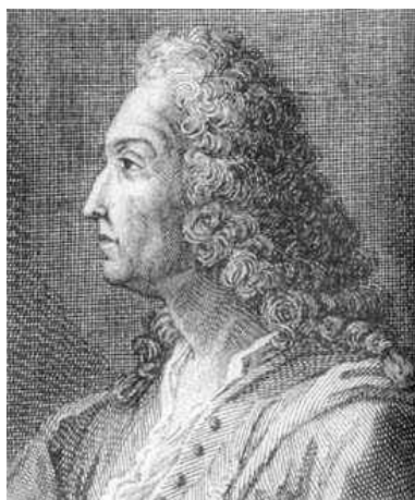
Figura 1: Ilustração de Jacob Bernoulli (1.654 - 1.705).

A Figura 1 traz uma imagem de Jacob, segundo a biografia disponibilizada pela Escola de Matemática e Estatística da University of St Andrews , Escócia.